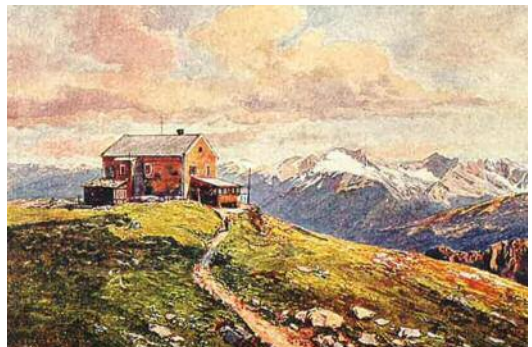
NaturFreundehaus auf dem Padasterjoch

1895 schlossen sich die ersten NaturFreunde zusammen, um die Natur als Quelle der Erholung zu erkunden, gemeinsam zusammenzutreffen, sich fortzubilden