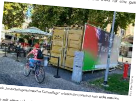
Das „sanierungsmassnahmen“ werden die Container nach nicht installiert.

nach mit Schüttungsbindigkeit fahren dürfen und das Kopfsteinbild links die Erklärung von Kulturbau-staatsrat Anne Braun (Grüne) aus „Wiss für eine gute