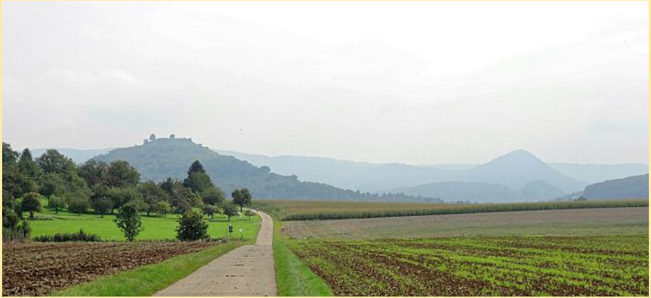
Blick zur Limburg.

Info: Ben van den Berg, 0152 53 54 59 86.