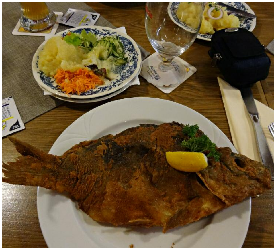
Im Herbst werden die Fischteiche abgefischt.