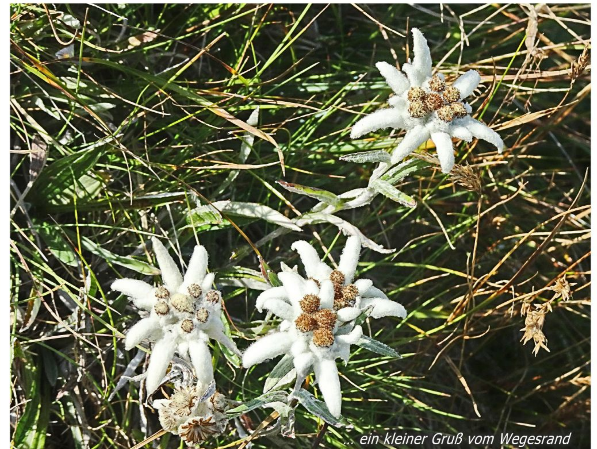
... ein kleiner Gruß vom Wegesrand