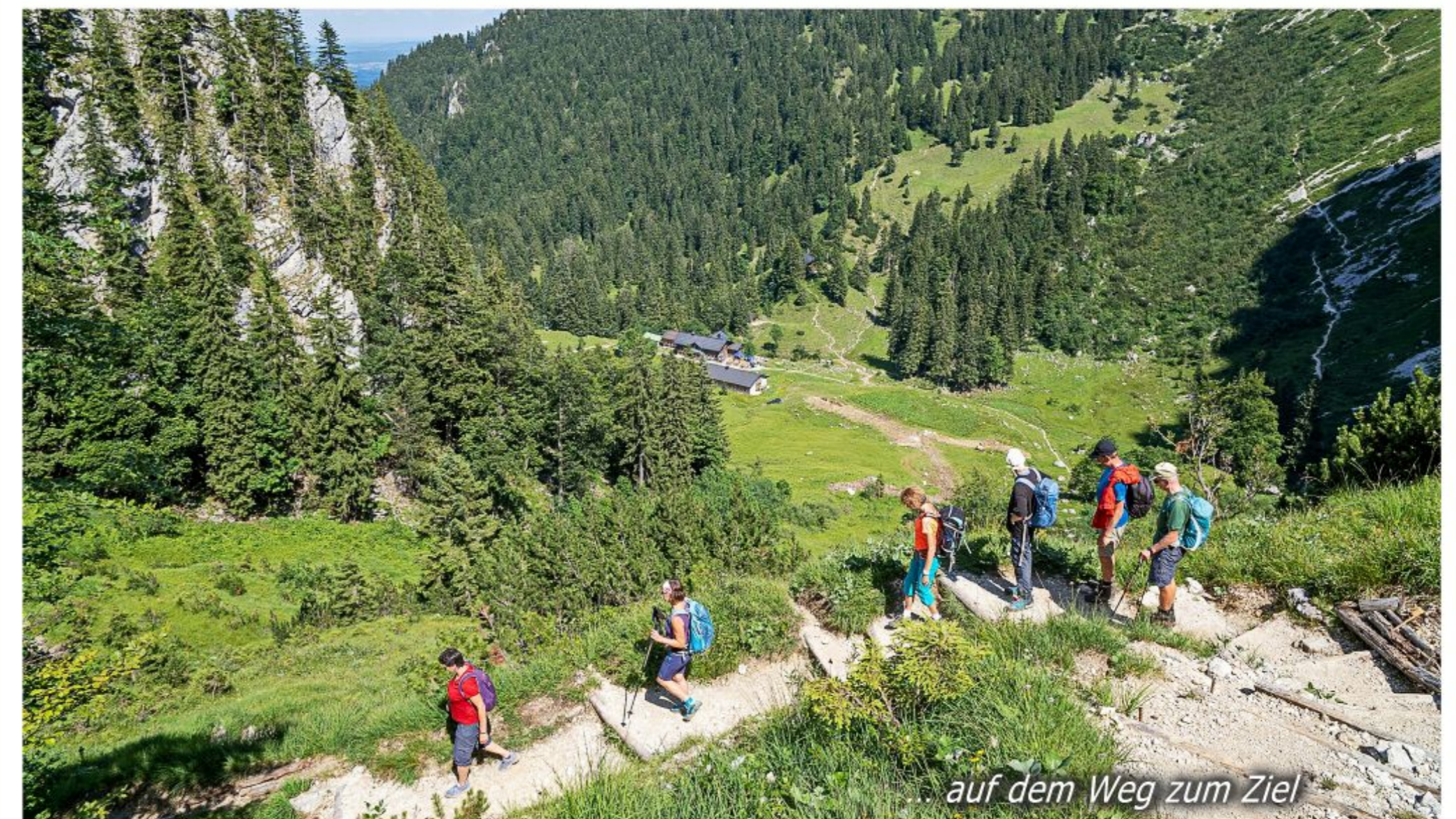
auf dem Weg zum Ziel