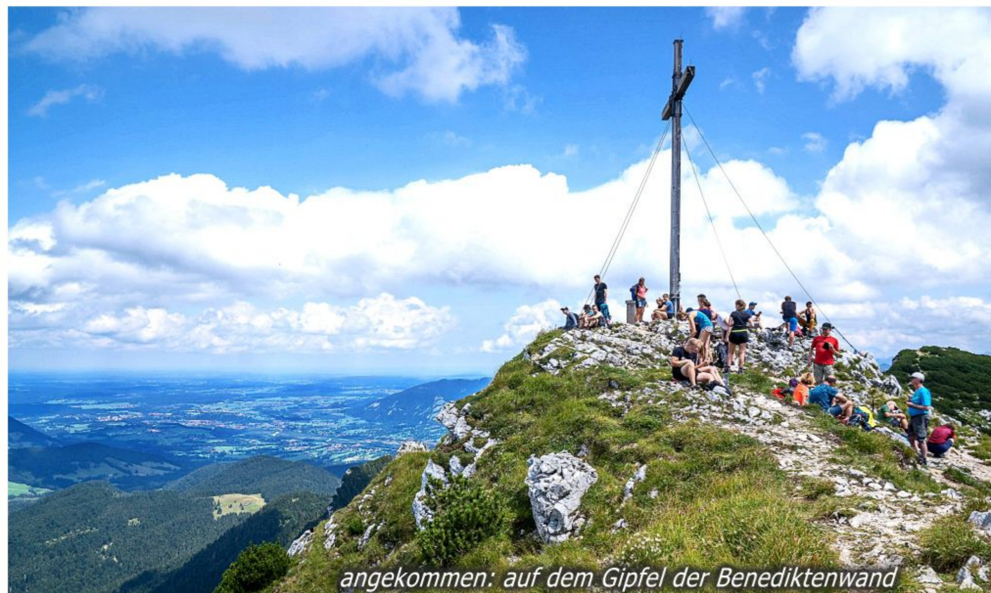
angekommen: auf dem Gipfel der Benediktenwand